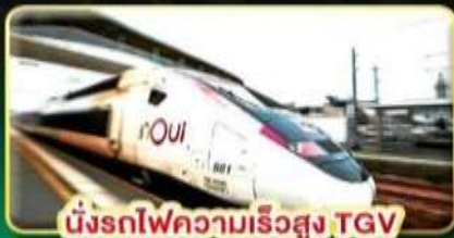
นั่งรถไฟความเร็วสูง TGV