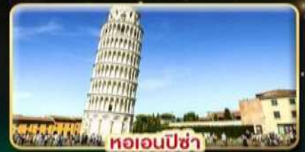
หออนปีซ่า