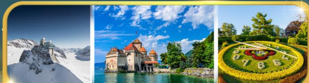
ยอดเขาจุงเฟรา ปราสาทซิลยง นาฬิกาดอกไม้เมืองเจนีวา

กระเช้าไอเกอร์ : ยอดเขาจุงเฟรา | กระเช้า : ยอดเขาโคลน์แมทเทอร์ฮอร์น กับ ดินแดนห้าหมู่บ้านซิงเกวแตรส์