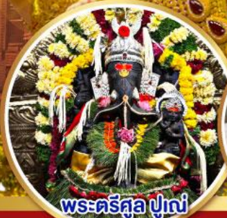
พระศรีศูล ปูणे (Trishul Pune)