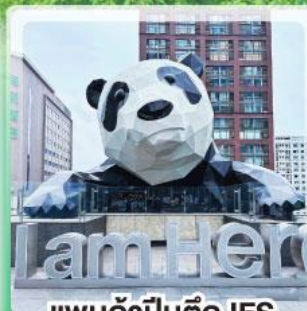
แพนด้าป็นตึก IFS