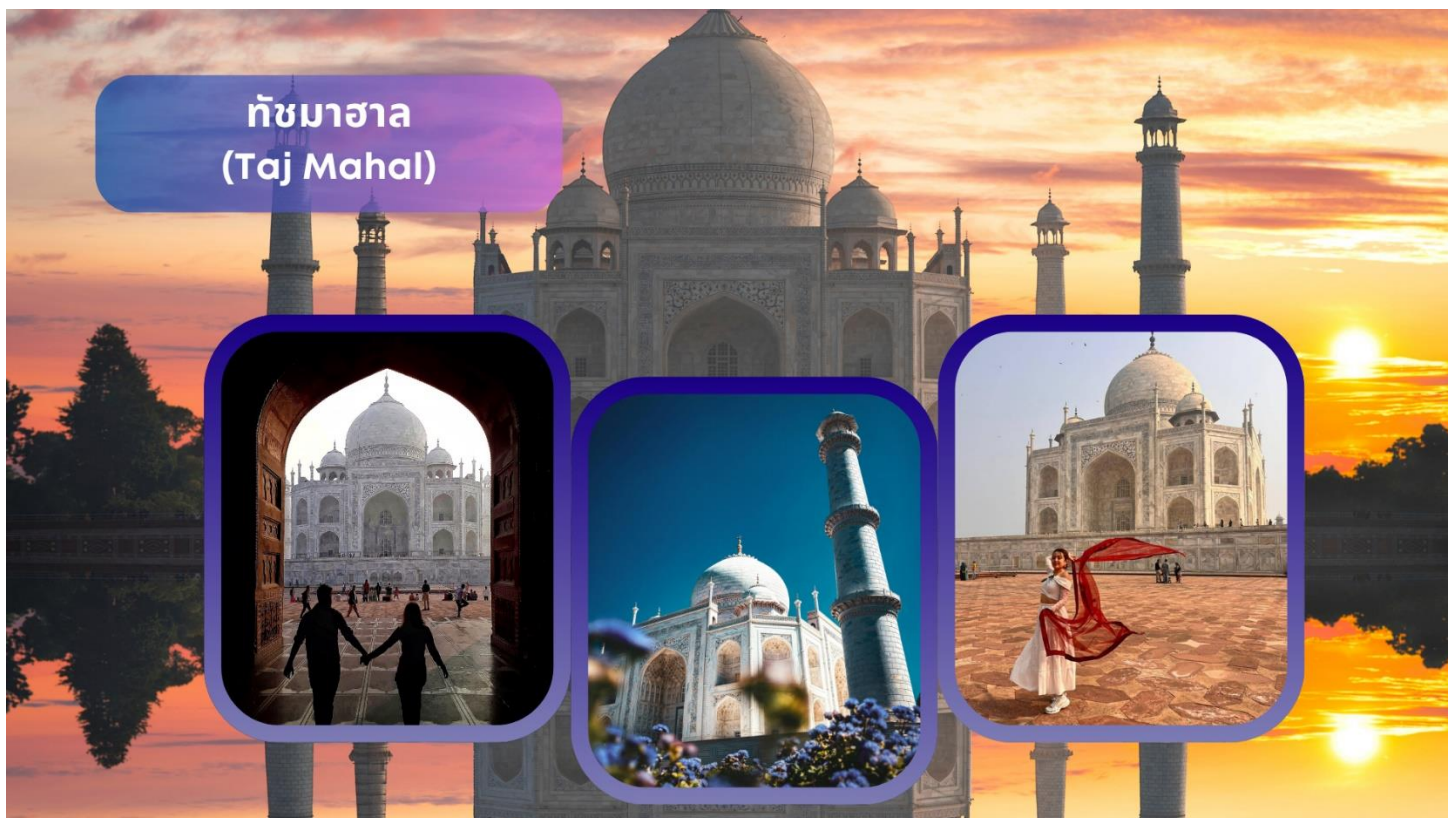
ทัชมาฮาล (Taj Mahal)

เข้าชมด้านใน ทัชมาฮาล (Taj Mahal) แหล่งมรดกโลกและเป็น 1 ใน 7 สิ่งมหัศจรรย์ที่สำคัญของโลก นำท่านเดินสู่ประตูสุสานที่สลักตัวหนังสือภาษาอาหรับที่เป็นถ้อยคำอุทิศและอาลัยต่อบุคคลอันเป็นที่รักที่จากไปอนุสรณ์สถานแห่งความรักอันยิ่งใหญ่และอมตะของพระเจ้าชาห์จาฮันที่มีต่อพระนางมุมตซ์ โดยสร้างขึ้นในปี ค.ศ. 1631 และนำท่านถ่ายรูปกับลานน้ำพุที่มีอาคารทัชมาฮาลอยู่เบื้องหลัง แล้วนำท่านเข้าสู่ตัวอาคารที่สร้างจากหินอ่อนสีขาวบริสุทธิ์ที่ประดับลวดลายด้วยเทคนิคฝังหินสีต่างๆ ลงไปในเนื้อหิน สถาปัตยกรรมชิ้นเอกของโลกที่ออกแบบโดยช่างจากเปอร์เซีย โดยอาคารตรงกลางจะเป็นรูปโดมซึ่งมีหอคอยสี่เสาล้อมรอบ ตรงกลางด้านในเป็นที่ฝังพระศพของพระนางมุมตซ์ มาฮาล และ พระเจ้าชาห์จาฮัน ได้อยู่คู่เคียงกันตลอดชั่วชีวิต ทัชมาฮาลแห่งนี้ใช้เวลาก่อสร้างทั้งหมด 22 ปี โดยสิ้นเงินไป 41 ล้านรูปี มีการใช้ทองคำประดับตกแต่งส่วนต่างๆ ของอาคารหนัก 500 กิโลกรัม และใช้คนงานกว่า 20,000 คน ต่อมานำท่านเดินอ้อมไปด้านหลังที่ติดกับแม่น้ำยมนาโดยฝั่งตรงกันข้ามจะมีพื้นที่ขนาดใหญ่ถูกปรับดินแล้ว โดยเล่ากันว่าพระเจ้าชาห์จาฮันเตรียมที่จะสร้างสุสานของตัวเองเป็นหินอ่อนสีดำโดยตัวรูปอาคารจะเป็นแบบเดียวกันกับทัชมาฮาล เพื่อที่จะอยู่เคียงข้างกัน แต่ถูกออรังเซบ ยึดอำนาจและนำตัวไปคุมขังไว้ในป้อมอัคราเสียก่อน **เนื่องจากทัชมาฮาลปิดทุกวันศุกร์ กรณีที่เข้าทัชมาฮาลตรงกับวันศุกร์ ทางบริษัทขอสงวนสิทธิ์สลับโปรแกรมเที่ยวตามความเหมาะสม**