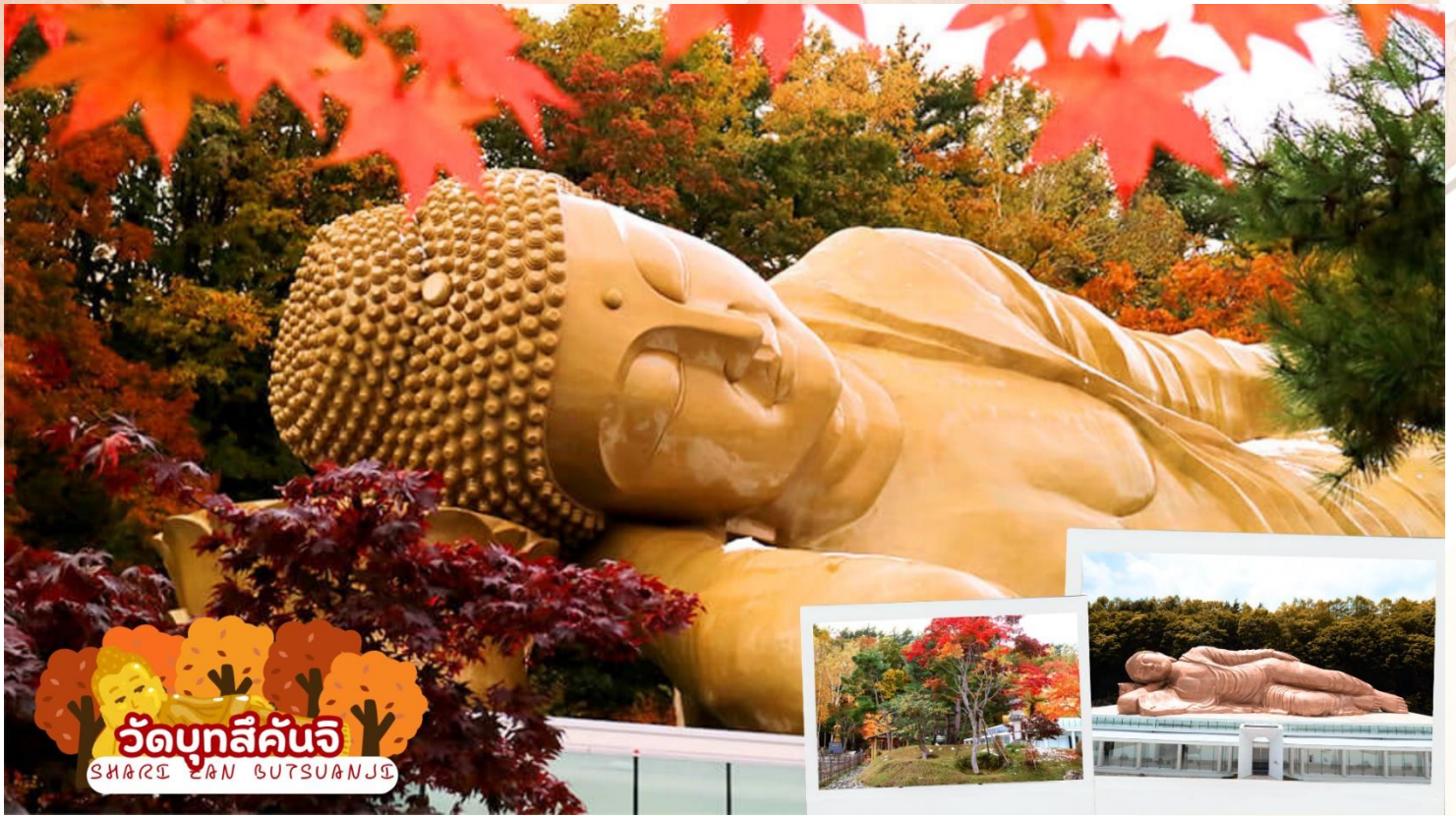
วัดบุทลีคันจิ SHARI-ZAN BUTSUANJI

เดินทางสู่ วัดบุทลีคันจิ (Shari-Zan Butsuanji) ตั้งอยู่เขตมินามิ เมืองซัปโปโร เป็นสถานที่ศักดิ์สิทธิ์ทางพุทธศาสนา ภายในบริเวณมีที่สักการะพระบรมสารีริกธาตุและพระนอนขนาดใหญ่ เป็นสถานที่สำคัญในการขอพรและเป็นจุดรับพลังที่ดีมาก ท่านใดที่มีโอกาสได้มาเยือนฮอกไกโด ต้องไม่พลาดการมาขอพรพระนอนที่นี่ พร้อมกับรับพลังศักดิ์สิทธิ์กลับมาอย่างเต็มเปี่ยม