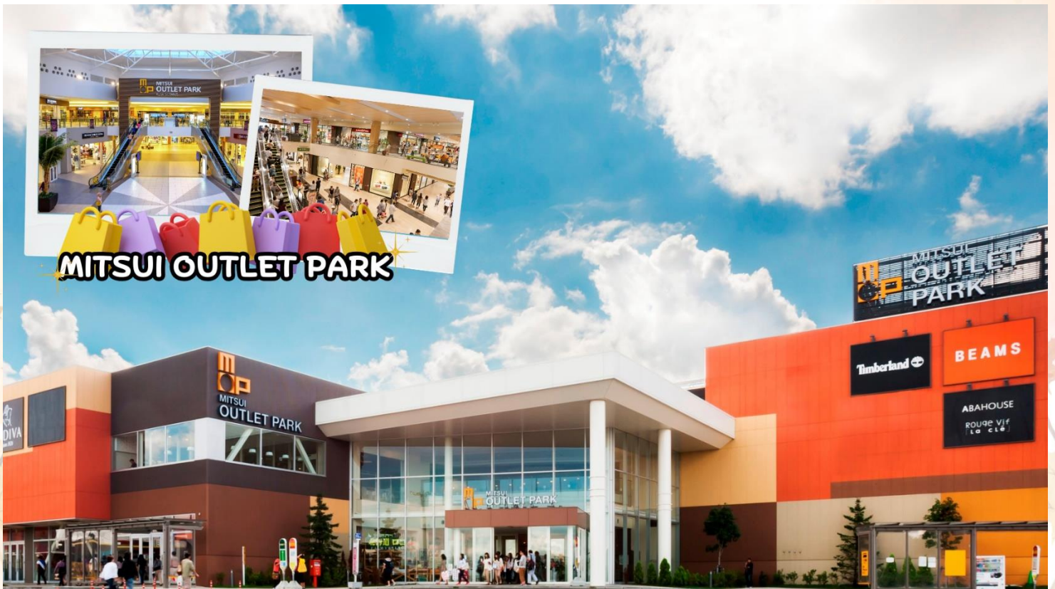
MITSUI OUTLET PARK

เดินทางสู่ วัดบุทลีคันจิ (Shari-Zan Butsuanji) ตั้งอยู่เขตมินามิ เมืองซัปโปโร เป็นสถานที่ศักดิ์สิทธิ์ทางพุทธศาสนา ภายในบริเวณมีที่สักการะพระบรมสารีริกธาตุและพระนอนขนาดใหญ่ เป็นสถานที่สำคัญในการขอพรและเป็นจุดรับพลังที่ดีมาก ท่านใดที่มีโอกาสได้มาเยือนฮอกไกโด ต้องไม่พลาดการมาขอพรพระนอนที่นี่ พร้อมกับรับพลังศักดิ์สิทธิ์กลับมาอย่างเต็มเปี่ยม