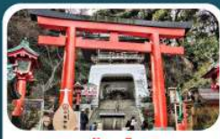
ศาลเจ้าอินะชิมะ