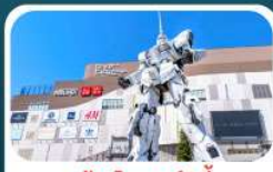
ห้างไดเวอร์ซิตี