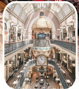
QUEEN VICTORIA BUILDING