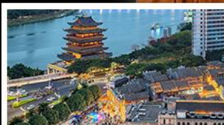
ถนนคนเดินสามตรอกสองซอย