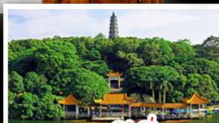
ภูเขาชิงชิว