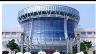
พิพิธภัณฑ์ทิวาสี

สวนสนุก FANTASYLAND - หมู่บ้านสไตล์ยุโรป พิพิธภัณฑ์ทิวาสี - ถนนคนเดินสามตรอกสองซอย ท่าเรือกิ่งจื่อ - ศาลเจ้าแม่กวนอิมพันกร เมมูพิเศษ อาหารทิวาสี, สุกี้ชาบูหม่าล่า