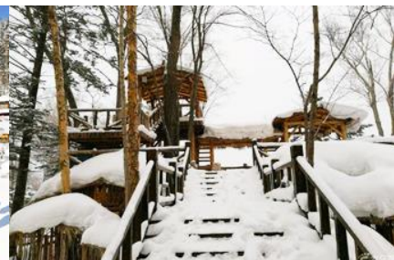
ระเบียงชมวิวปี้วูยซาน

วันที่สาม เมืองฮาร์บิน-สถานีรถไฟยาบูลี-รวมนั่งม้าลากเลื่อน- หมู่บ้านหิมะ Xue xiang China Snow Town - ระเบียงชมวิว เขาปี้วูยซาน- ชมแสงสียามราตรีหมู่บ้านหิมะ-ชมพลุไฟและขบวนพาเหรดระบำพื้นเมือง-นอนในหมู่บ้านหิมะ Xue xiang