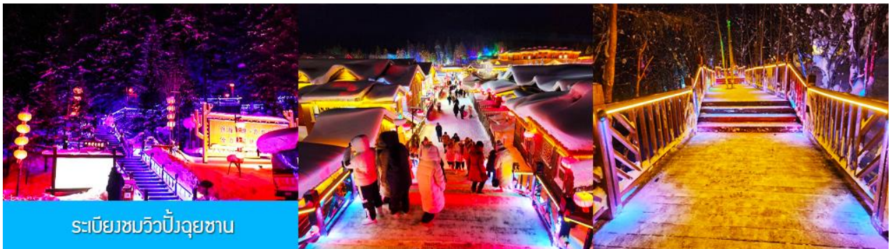
ระเบียบชมวิวยังอุทยาน

เมื่อเดินทางถึงหมู่บ้านหิมะ นำท่านเปลี่ยนมาใช้รถบัสของอุทยานเดินทางเข้าหมู่บ้าน เนื่องจากรถบัสที่อาจจะไม่สามารถเข้าไปในหมู่บ้านได้ นำท่านเช็คอินเข้าที่พักเรียบร้อยแล้ว