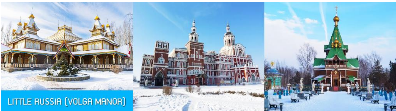
LITTLE RUSSIA (VOLGA MANOR)

รับประทานอาหารเช้า ณ ห้องอาหารของโรงแรม (13)