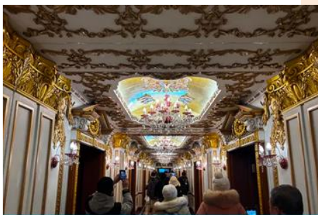
ตึกเภสัชกรรมฮาร์บิน

จากนั้นนำท่านเที่ยวชม ถนนจางยงลู่ 中央大街 ถนนสายหลักของเมืองฮาร์บิน ถนนที่เต็มไปด้วยอาคารบ้านเรือนที่เป็นสถาปัตยกรรมตะวันตกที่สร้างในช่วงคริสต์ศตวรรษที่ 18 – 19 ที่เมืองนี้ถูกปกครองโดยรัสเซีย อีกทั้งเป็นถนนคนเดินที่เป็นแหล่งรวมร้านค้าสินค้าแบรนด์เนมทั้งในและต่างประเทศ ร้านจำหน่ายของที่ระลึกและสินค้าพื้นเมือง ร้านอาหารพื้นเมืองต่าง ๆ มากมาย ให้ท่านมีเวลาอิสระเดินเที่ยวและช้อปปิ้ง หรือลิ้มรสอาหารพื้นเมืองตามอัธยาศัย.. **ให้ท่านลิ้มรสไอศกรีมชื่อดังเก่าแก่ของเมืองฮาร์บินท่านละ 1 ท่านฟรี