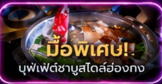
มือพิเศษ! บุฟเฟ่ต์ชาบูสุโตส์ฮ่องกง