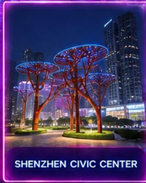
SHENZHEN CIVIC CENTER

ชมสถาปัตยกรรมระดับโลก พิพิธภัณฑ์ศิลปะร่วมสมัยเซินเจิ้น (MOCAPE) และ Shenzhen Civic Center