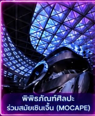
พิพิธภัณฑ์ศิลปะ ร่วมสมัยเซินเจิ้น (MOCAPE)