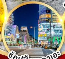
ช้อปปิ้งซากาเอะ