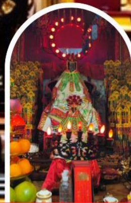
วัดเจ้าแม่กวนอิมฮ่องฮำ

เสริมโชคกลางนำความรุ่งเรืองทุกด้านของชีวิต