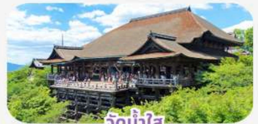
วัดน้ำใส