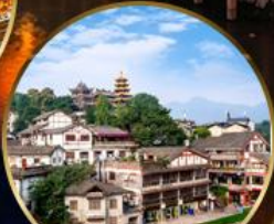
เมืองโบราณฉือจี้โข่ว