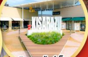
มิตซึยะ เอ้าท์เล็ต พาร์ค คิชะระชู