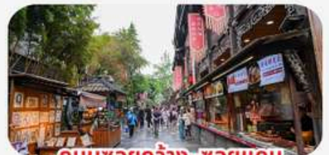
ถนนชวยกว้าง-ชวยแคบ