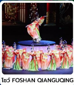
โชว์ FOSHAN QIANGUING