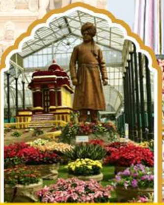
บังกาลอร์