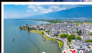
ทะเลสาบเอ๋อไห่