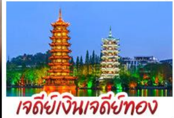
เจตีย์เงินเจตีย์ทอง