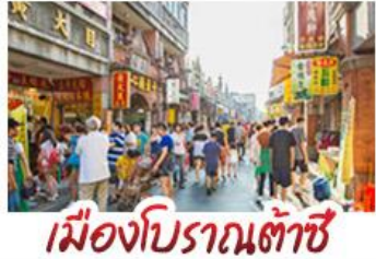
เมืองโบราณต้าซี

ล่องแพไม้ไผ่ชมแม่น้ำหลี่เจียง - งามวงซำง กำลู่ย้อ - เมืองโบราณต้าซี เจตีย์เงินเจตีย์ทอง ซ้อปั้งถนคนเตน - ถนคนตงซีเซียง - ถนคนซีเจียง เมบูพิศษ บูฟพิศษบูชี่ฟุด ปลายอบเบียร์ สุกี้หัด