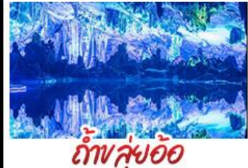
ถ้ำลู่ย้อ