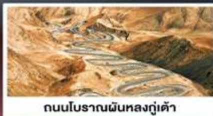
ถนนโบราณผืนหลงกู่เต้า