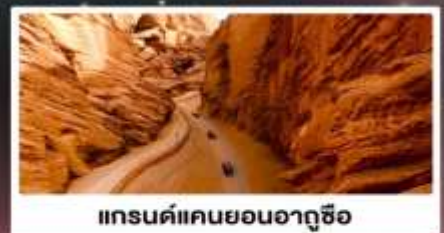
แกรนด์แคนยอนอาถูซื่อ