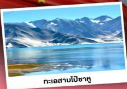
ทะเลสาบไปซาทุ

เปิดประตูสู่อารยธรรมพันปีแห่งซินเจียงใต้ ชมความสวยงามของหมู่บ้านดอกแอปเปิล