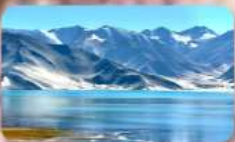
ทะเลสาบไป่ซาหู