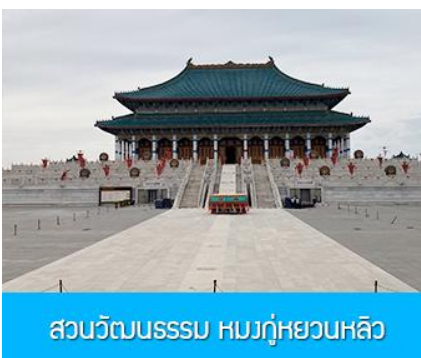
สวนวัฒนธรรม หมงกู่หยวนหลิว

หลังอาหารนำท่าน เที่ยวชม จวนอ๋องจวินหวัง 郡王府 จวนแห่งนี้เริ่มสร้างขึ้นในปี ค.ศ. 1902 สร้างเสร็จในปี ค.ศ. 1936 เป็นที่พำนักของ อ๋องอิฉิจวินหวัง 伊旗郡王 เป็นจวนอ๋องเพียงหนึ่งเดียวที่ได้รับการอนุรักษ์ในสภาพที่สมบูรณ์ โครงสร้างทำด้วยอิฐ หิน และไม้ ประกอบด้วยห้องพัก 16 ห้อง เป็นสถาปัตยกรรมผสมแบบมองโกล ทิเบต และฮั่น