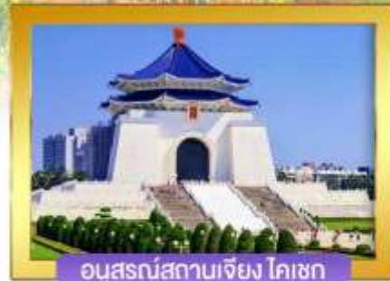
อนุสรณ์สถานเจียง ไคเชก