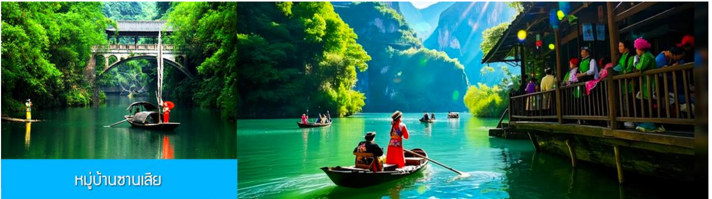
หมู่บ้านชาวนเลีย

พักที่ YICHANG HUIHAO HOTEL โรงแรมระดับ 4 ดาวหรือเทียบเท่าในเมืองหยี่ชาง