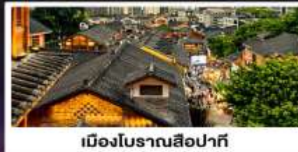
เมืองโบราณสี่ปาที้