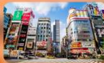
ซ้อปปิ้งชินจูกุ