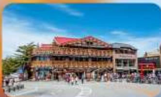
ภูเขาไฟฟูจิ ชั้นที่ 5