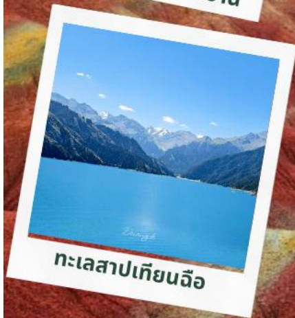
ทะเลสาปเทียนฉือ