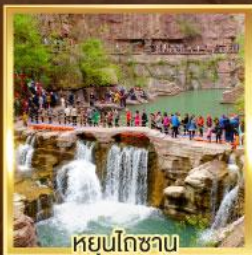
หยุ่นโกซ่าน