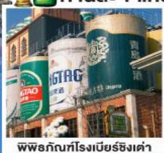
พิพิธภัณฑ์โรงเบียร์ชิงเต่า