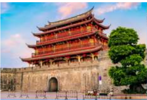
เมืองโบราณเต้จิ๋ว

พักที่ โรงแรม HAKKA TULOU PRINCE HOTEL 4* หรือเทียบเท่าในเมืองหย่งตั้ง