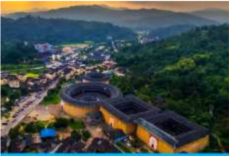
บ้านดินโบราณกุโหลวกาเปย

เจิงจีโหลว หู่หยุนโหลว ซื่อเจ้อโหลว ฯลฯ ได้รับสมญานามว่าเป็น ราชาแห่งบ้านดิน กลุ่มบ้านดินหลายหลังนี้เป็นบ้านพักอาศัยของชาวจีนและตระกูลเจียง 江氏 นำท่านเที่ยวชม บ้านดินเจิงจีโหลว 承启楼