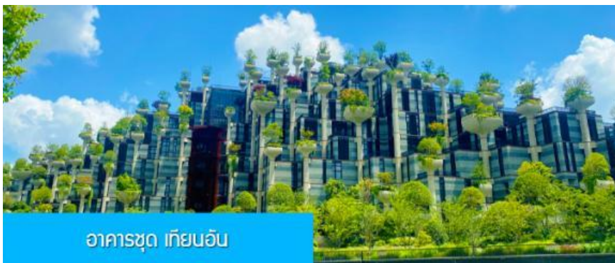
อาคารชุด เทียนอัน

เที่ยง รับประทานอาหารกลางวัน ณ ภัตตาคาร (6)