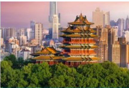
นครนานกิง