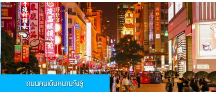
ถนนคนเดินหนานจิงลุ่

จากนั้นนำท่านเดินทางสู่ ย่านช้อปปิ้งที่ใหญ่และคึกคักที่สุดของมหานครเซี่ยงไฮ้ ถนนคนเดินหนานจิงลุ่ 南京路步行街 ให้ท่านเพลิดเพลินกับการเดินเที่ยว ชม และ ช้อปปิ้ง ชิมอาหารหรือของทานเล่นอย่างจุใจ ในย่านถนนคนเดินนี้ นอกจากร้านค้าสินค้าแบรนด์เนมจากต่างประเทศแล้ว สินค้าแฟชั่น และสินค้าแบรนด์จีนก็มีให้เลือกอย่างมากมาย ร้านอาหารและเครื่องดื่มก็มีให้เลือกนั่งเลือกชิมมากมาย.. หรือ ตามล่าหา ลาบูมู ที่ร้าน POP MART ที่ใหญ่ที่สุดในเมืองเซี่ยงไฮ้