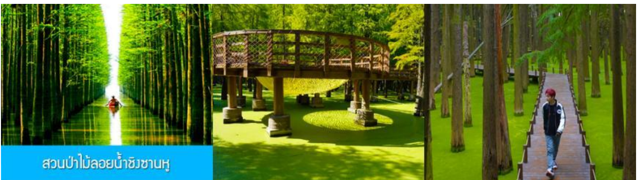
สวนป่าไผ่ลอยน้ำชิงชานหู

พักที่ โรงแรม Holiday Inn Express Hotel 4* หรือเทียบเท่าในนครเซี่ยงไฮ้