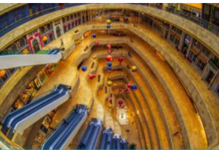
จัตุรัสเต๋อจี

พักที่ โรงแรม Holiday Inn Express Dongshan Hotel 4* หรือเทียบเท่าในนครหนานจิง