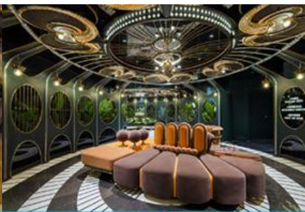
ห้องน้ำไอเทค