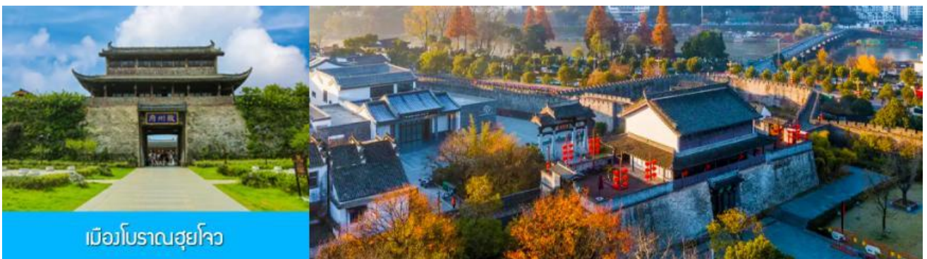
เมืองโบราณซูโจว

จากนั้นนำท่านเดินทางโดยรถบัสสู่ เมืองโบราณซูโจว (ระยะทาง 149 กม. ใช้เวลาเดินทางราว 2 ชั่วโมงเศษ)