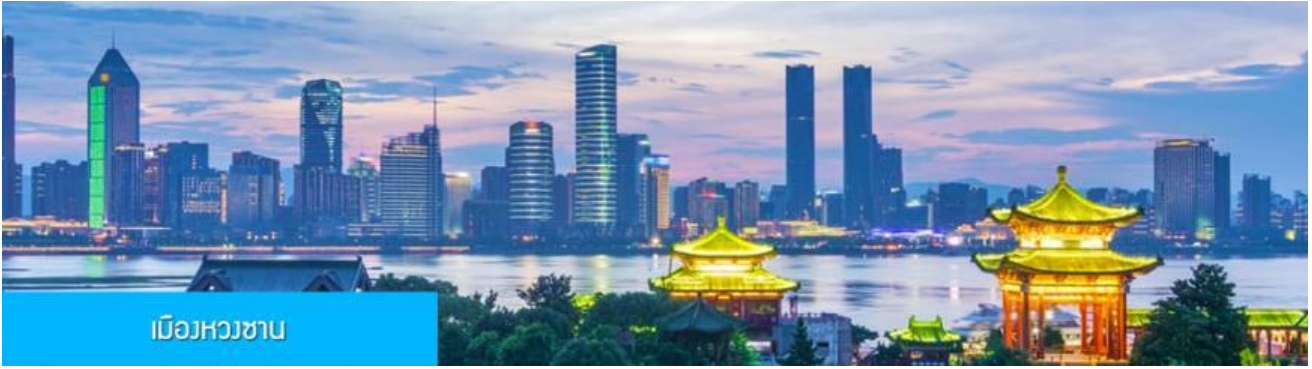
เมืองหวงซาน