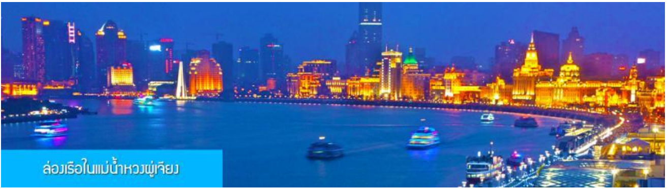
ล่องเรือในแม่น้ำหวงผู่เจียง