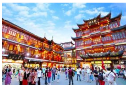
ตลาดร้อยปีฉงหวงเมี่ยว

พักที่ โรงแรม Holiday Inn Express Hotel 4* หรือเทียบเท่าในนครเซี่ยงไฮ้