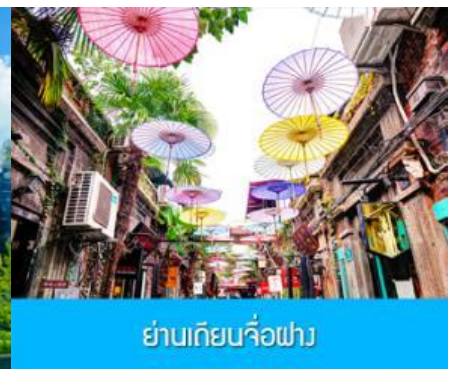
ย่านเกียบจื่อฝาง