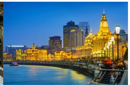
หาดไว่กาน