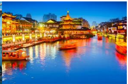
ย่านฟูจื่อเมี่ยว