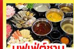
บุฟเฟ่ต์ซาบู