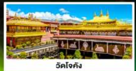
วัดโจกัง

🏠 พักบนรถไฟ 1 คืน ห้องละ 4 เตียง (บน 2/ล่าง 2)