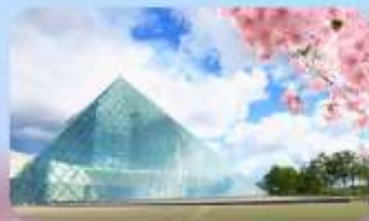
Glass Pyramid "HIDAMARI"