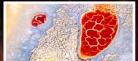
ทะเลสาบอูลาน