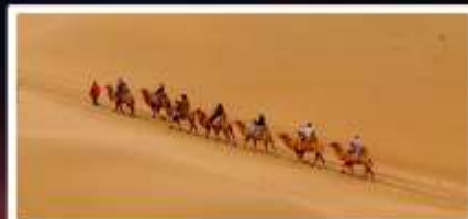
เป็นทรายเสี่ยงชาวน