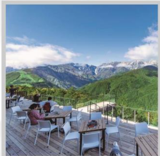
“HAKUBA MOUNTAIN HARBOR”

นำท่านไปโอบกอดธรรมชาติที่ครบครันในที่เดียว “คามิโคจิ” สวิสเซอร์แลนด์แดนญี่ปุ่นเทือกเขาที่ปกคลุมด้วยหิมะสวยงาม ชมความงามของ “ทุ่งพืชมอส ฟุจิชิบะซากุระ” มนต์เสน่ห์..พรมธรรมชาติสีชมพูหลากสีสดใส เปลี่ยนอริยาบท “จันทรະเข้าฮาคุบะ อิวะตะกะ” เพื่อชมวิวพาโนรามาของเทือกเขาแอลป์ญี่ปุ่นกันให้อิ่มใจ สัมผัสกลิ่นอายเมืองเก่า “เมืองทาคายามา” ที่ยังคงอนุรักษ์ความเป็นอยู่ เมื่อสมัยเอโดะกว่า 300 ปี สายช้อปปิ้งห้ามพลาด “คารุอิซาวะ เอ้าท์เล็ต” แลนด์มาร์กของเมืองคารุอิซาวะ และ “ย่านชินจูกุ” แห่งเมืองโตเกียว ชมความงามกับเส้นทาง “เจแปนแอลป์ (ท่าแพงหิมะ)” สุดยอดของการท่องเที่ยวที่ถูกขนานนามว่า “หลังคาแห่งญี่ปุ่น”