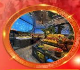
มือพิเศษ บุฟเฟต์นานาชาติ