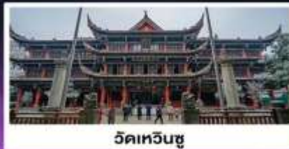
วัดเหวินซู