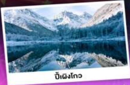
บี้ฝิงโกว

เทือกเขาแอลป์เมืองจีน "ภูเขาสิ่วรุณี" ชมความสวยงามของอุทยานบี้ฝิงโกว