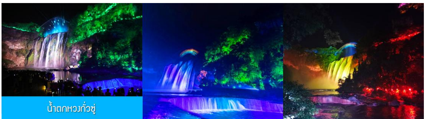
น้ำตกหวงกั๋วซู

รับประทานอาหารเย็น ณ ภัตตาคาร (มื้อที่ 6)