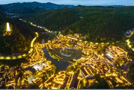
เมืองโบราณวูเจียงจ้าย