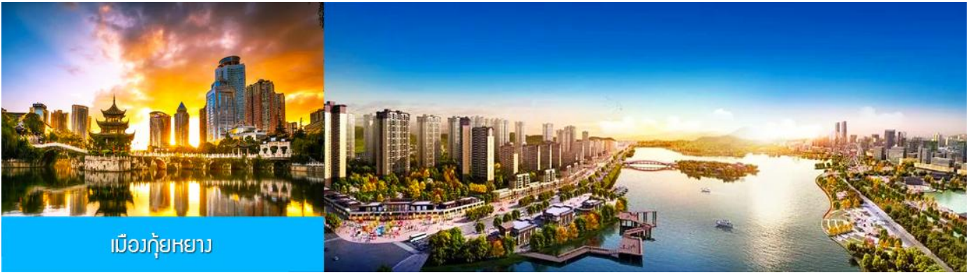
เมืองกู่หยาง