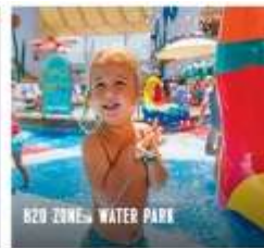
B20 ZONES WATER PARK