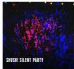
SHUSHI SILENT PARTY