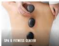
SPA & FITNESS CENTER